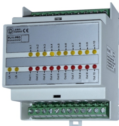
Dimensioni Contenitore 4 Moduli guida DIN

PL11A-PRO Modulo PLC (1 Ingresso Analogico + 9 Ingressi digitali e 10 Uscite digitali).